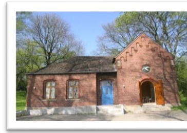
„Haus Jona am Berg“ (LWL-Gelände - Haus 26)